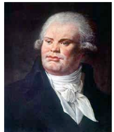
Als Danton die von ihm selbst mitinstallierte Terrorherrschaft ablehnte, wurde er 1794 als Verschwörer gegen die Revolution hingerichtet.