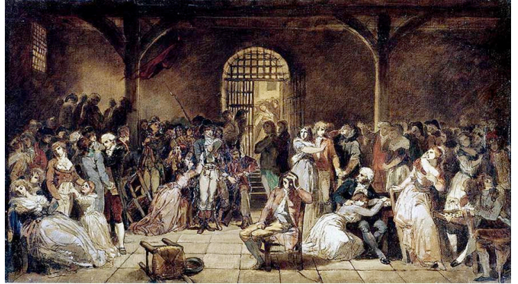
Eingekerkerte Adelige 1793, vor den Septembermorden

Auf dem Weg zur Guillotine ruft Danton: „Bald ist die Reihe an dir!“ Tatsächlich endet auch Robespierres Diktatur ein paar Monate später. „Nieder mit dem Tyrannen!“, schreit das Volk im Juli 1794, als Robespierre das Fallbeil trifft.