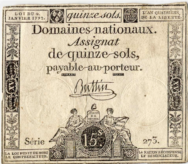
Assignat , die „Banknote“ der Revolution.

Um enorme Schuldenlast des Staates abzubezahlen, hatte die Nationalversammlung schon Ende 1789 die Kirchengüter zugunsten des Staates eingezogen. Weil man nicht hoffen konnte, innerhalb kurzer Zeit den Landbesitz zu verkaufen, zahlte man den Kreditgebern die Schuld in Form von Assignaten. Diese Papiere konnten gegen die zur Verfügung stehenden Landgüter eingetauscht werden, wurden aber vornehmlich in Umlauf gebracht und entwickelten sich dadurch zum allgemeinen Zahlungsmittel. Anfänglich hatte das neue Geld eine wohltuende Wirkung. Die französische Wirtschaft wurde belebt und die Bauern solidarisierten sich durch das verteilte Land mit der Revolution. Mit der Zeit wurden durch die Regierung immer mehr Assignaten in Umlauf gebracht, was eine starke Inflation zur Folge hatte, zu welcher auch die allgemeine politische Instabilität beitrug. Zahlreiche englische Fälschungen ließen das Vertrauen in die Assignaten-Währung zusätzlich sinken. Im Februar 1793 hatten sie nur noch 50 Prozent ihres ursprünglichen Wertes. Es kam zum Horten von Lebensmitteln, was die Jakobiner jedoch per Gesetz verboten. Das konnte die Inflation jedoch nur vorübergehend bremsen. Im April 1795 sank der Wert der Assignaten auf 8 Prozent. Viele Kaufleute weigerten sich daraufhin, Papiergeld anzunehmen, wodurch die in Assignaten bezahlten Arbeiter verarmten.