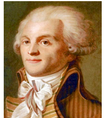
Der fanatische Robespierre führte die Schreckensherrschaft zum Höhepunkt.

Lebensmittel blieben knapp. Korruption machte sich breit. Der „weiße Terror“ verfolgte die Jakobiner, royalistische Erhebungen bedrohten das Direktorium. Diesen inneren Schwierigkeiten wurde das Direktorium nur mit Hilfe der Armee Herr. Der erfolgreichste Feldherr gewann so den größten politischen Einfluss. Dies war ab 1797 ein junger General namens Napoleon Bonaparte.