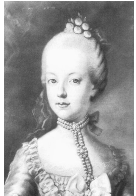
Das Portrait von Marie Antoinette, das der Hof in Wien nach Versailles schickte.

Marie Antoinette bemühte sich, das Beste aus ihrem seltsamen Louis zu machen. Sie gewöhnte ihm seine Gier nach Kuchen und seine unmäßige Leidenschaft für die Jagd ab. Gemeinsam machten sie einen Staatsbesuch in Paris, wo, wie Marie Antoinette an ihre Mutter, die Kaiserin von Österreich, schrieb, „die armen Leute, trotz der drückenden Steuern, außer sich waren vor Freude, uns zu sehen. Was für ein Glück, die Freundschaft eines Volkes so leicht zu gewinnen, obwohl es doch nichts Kostbareres gibt. Das habe ich tief empfunden, und ich will es nie vergessen.“ „Nie“ sagt man leicht, wenn man jung und fröhlich und verwöhnt ist. Marie-Antoinette war leichtsinnig und starrköpfig, aber auch warmherzig und bereit, eine gute Frau und Mutter zu werden.