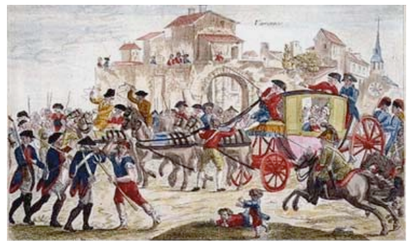
Retour de Varennes.