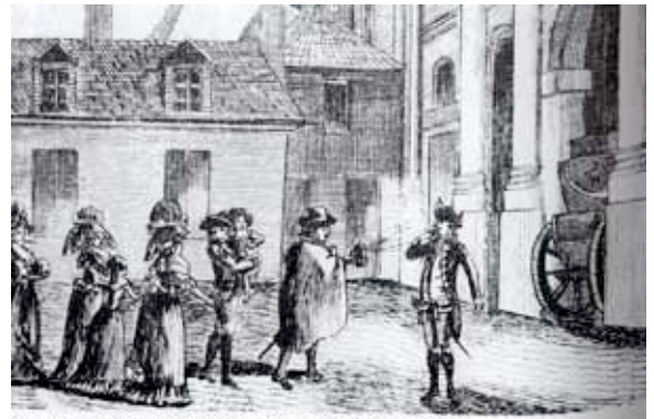
Fersen prépare la fuite de la famille royale.

An diesem milden, klaren Oktobertag musste die königliche Familie Trianon für immer verlassen. Sie wurde in den Tuileries, dem grimmigen, alten Palast in Paris, untergebracht. Hier lebte sie bange Monate in einem Zustand, der einer Haft nahe kam. Anfang Juni jedoch wurde es klar, dass keine andere Rettung blieb als die Flucht.