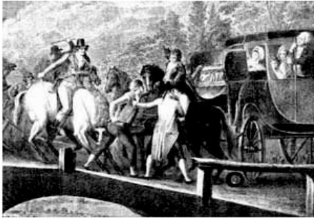
Arrestation de la famille royale à Varennes

Früh am Morgen machten die Belagerer ein paar Wachtposten nieder und drangen ins Schloss ein. Nur halb bekleidet flüchtete Marie Antoinette zum König, während hinter ihr die Horde in ihr Schlafgemach einbrach. Das königliche Paar saß auf einem Diwan,