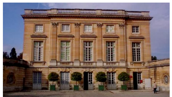
Le Petit Trianon im Garten von Versailles

Im Frühling 1774, als die Bäume und Rasenflächen im großen Park von Versailles grün wurden, bekam der König die Pocken und starb. Ludwig XVI. mit neunzehn Jahren und Marie Antoinette, die nun achtzehn war, bestiegen den Thron. Das Leben am Hof war strengen und komplizierten Regeln unterworfen. Die junge Herrscherin war eine Gefangene dieser Etikette. Nicht einmal ankleiden durfte sie sich allein. Oft stand sie vor Kälte zitternd da, während ihr Hemd von einer Hofdame zur andern gereicht wurde, bis endlich die Königin sich damit bedecken durfte. Kein Wunder, dass sie dagegen rebellierte und sich in Vergnügungen stürzte. Sie ließ sich hundert neue Kleider im Jahr anfertigen und kaufte zahllose Brillantohrringe und -armbänder. Die Zeit vertrieb sie sich mit Pferderennen, Glücksspielen, Theateraufführungen. Bällen und lebenslustigen Freundinnen und Freunden. Sie ließ das kleine Trianon nach ihrem Geschmack herrichten, und dort empfing sie geistreiche junge Leute, die stets Heiterkeit und gute Laune mitbrachten.