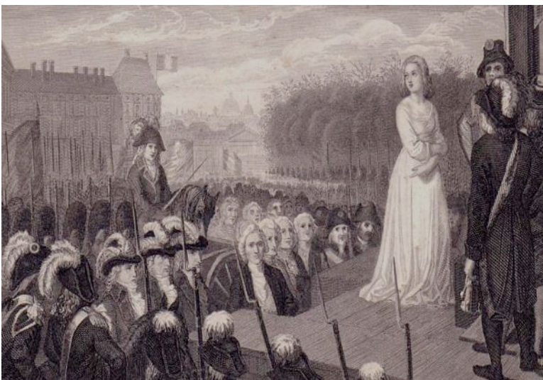
Die Hinrichtung Marie Antoinettes 1793

„Mein Gott! Hab Erbarmen mit mir! Meine Augen haben keine Tränen mehr, um um Euch, meine armen Kinder, zu weinen. Lebt wohl!“ Diese Worte schrieb Marie Antoinette wenige Stunden vor ihrer Hinrichtung am 16. Oktober 1793.