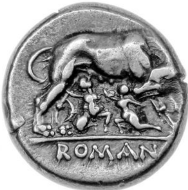
Lupa romana - Zweidrachenstück von 266 v.Chr.

Die Stadt Rom am Tiber in Italien ist über 2 500 Jahre alt. Römische Schriftsteller erzählen uns davon, wie die Menschen in der Antike gelebt haben. Heutige Forscher graben in den vielen erhaltenen Gebäuderesten und entdecken Gegenstände aus der Römerzeit. Auch diese Gegenstände erzählen aus dem Alltag der Römer.