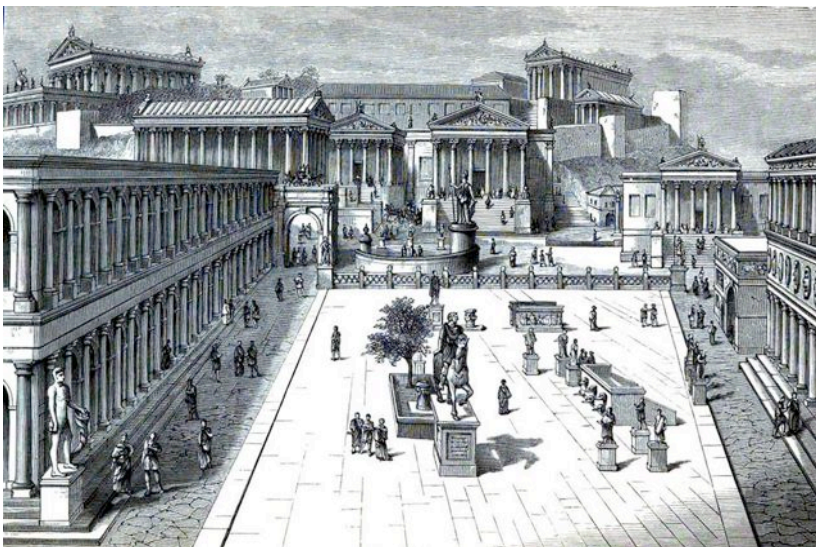
Das Forum Romanum - eine Art Marktplatz - war Mittelpunkt des politischen, wirtschaftlichen, kulturellen und religiösen Lebens. Es lag in einer Senke zwischen den drei Stadthügeln Kapitol, Palatin und Esquilin und war der Ort vieler öffentlicher Gebäude und Denkmäler.

Priester waren im Alten Rom sehr angesehen. Im Hauptberuf waren sie meist Politiker. Der Priester des Gottes Jupiter war der wichtigste. Er verrichtete den Tempeldienst. Vesta wurde als Göttin des Herdfeuers verehrt. Ihr dienten Priesterinnen, die Vestralinnen . Das Pantheon war ein Tempel für alle Götter. Es steht seit 2000 Jahren in Rom. Heute ist es eine christliche Kirche.