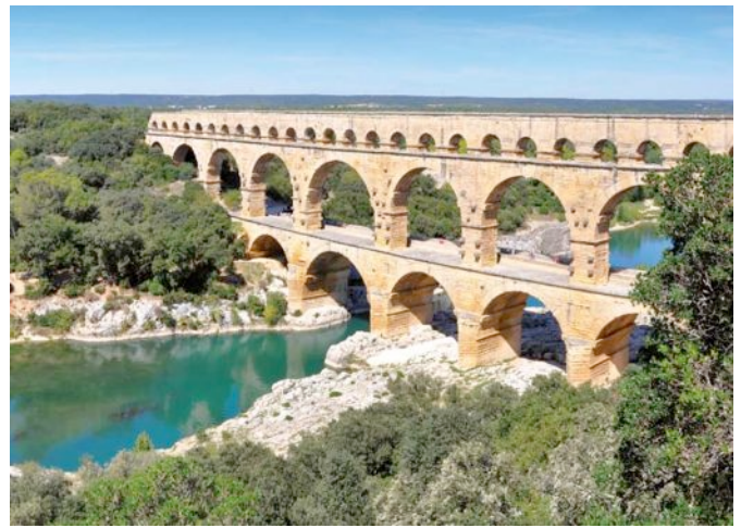
Der „Pont du Gard“ in Südfrankreich ist ein Aquädukt . Heute fließt zwar kein Wasser mehr, doch das Bauwerk steht seit 2000 Jahren. Wie steht's mit unseren heutigen Betonbrücken? - Sie müssen oft schon nach 30 Jahren totalsaniert werden!

Das Wasser für die Stadt und die Thermen kam aus den Bergen um Rom. Es wurde über Aquädukte in die Stadt geleitet. Das Wasser konnte sogar über tiefe Schluchten geleitet werden. Manche Aquädukte waren bis zu 40 Meter hoch.