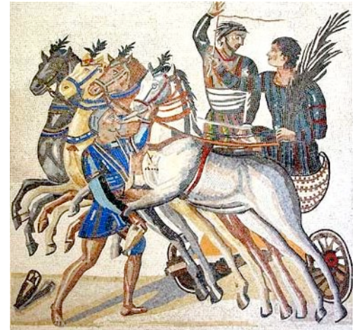
Römische Quadriga - Siegerehrung im Circus (Mosaik aus dem 3. Jh. n. Chr.)

Reiche Familien feierten am Abend häufig prächtige Feste . Feine Speisen und Getränke wurden im Liegen verzehrt. Tänzer und Musiker unterhielten die Gäste. Gerichte aus Flamingozungen oder Pfauen waren sehr beliebt. Die Römer aßen auch gerne Haselmäuse in Honig oder Elefantenrüssel.